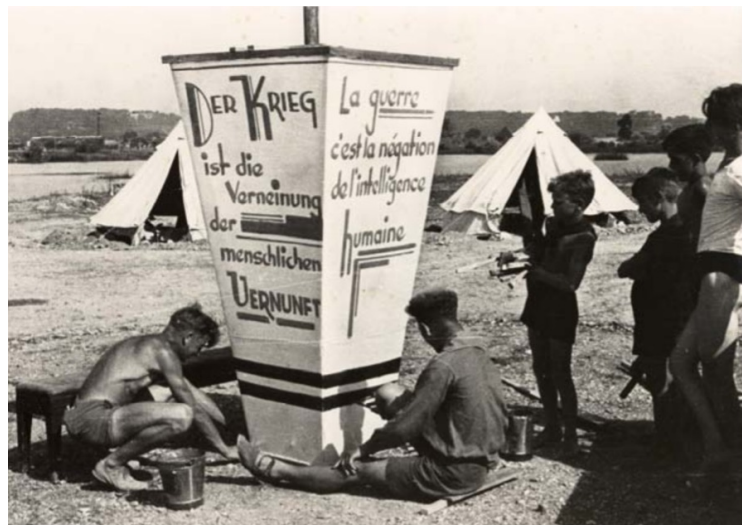
Kinderrepublik Draveil, 1932

Da zu erwarten ist, dass sich die angestrebte Zahl von 260.000 Soldaten nicht durch Freiwillige erreichen lässt, wurde jüngst von der Bundesregierung das Wehrdienst-Modernisierungsgesetz auf den Weg gebracht und Kinder und Jugendliche verstärkt zu Adressat:innen der aggressiven Werbung der Bundeswehr