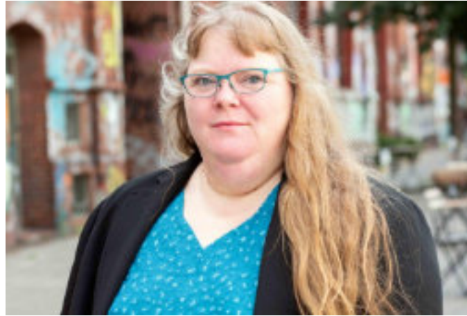
Beraterin Olga Fritzsche , Bürgerschaftsabgeordnete aus Eimsbüttel